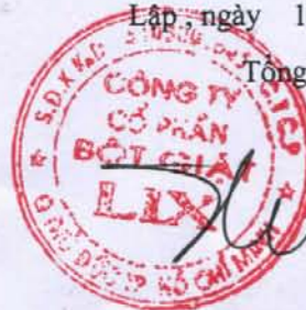
Cao Thành Tín